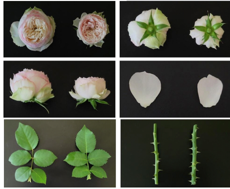
<‘세이렌’(좌), ‘맨스필드파크’(우)> 그림 2. 스프레이장미 ‘세이렌’ 형태적 특성