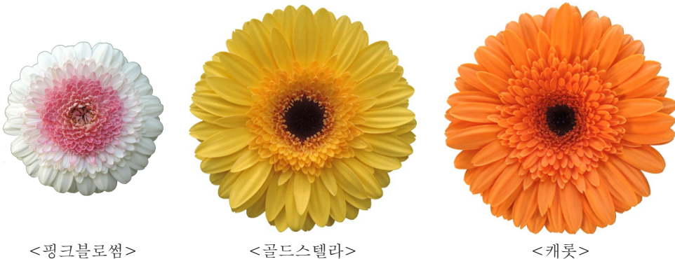
그림 1. 2022년 육성 거베라 신품종

거베라 우수계통을 2020년부터 2022년까지 3회의 특성검정 실시하였다. 특성조사 결과 화색, 화형 등이 우수한 3계통을 선발하여 2022년 경상남도종자위원회 직무육성 신품종 심의회의 심의를 통과하여 그림 1과 같이 신품종 '핑크블로썸', '골드스텔라', '캐롯' 3품종을 개발하였다.