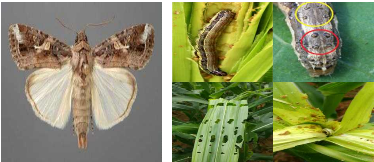
<성충, 유충>

➡ 약제선택은 농약정보서비스( http://pis.rda.go.kr ), 작물보호제 지침서를 참고하시고 관할 농업기술센터 또는 농업기술원에 문의하세요.