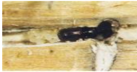
【오리나무좀 성충 및 알】