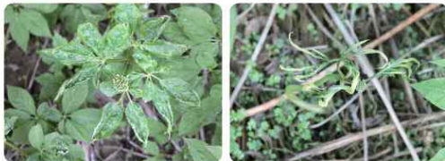
<저온에 의한 인삼 잎 피해>