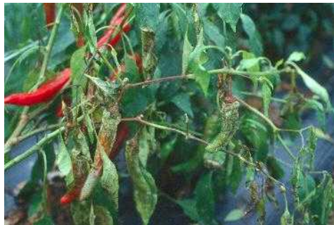
【고추 역병 피해 증상】