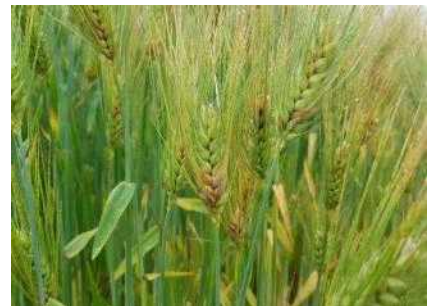
【보리 발병 이삭】