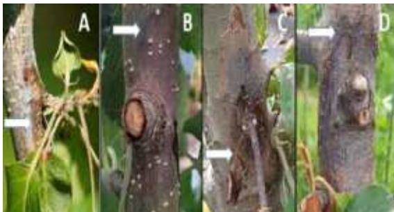
【과수화상병 병징: 수침상 시기별 변화(좌우)】