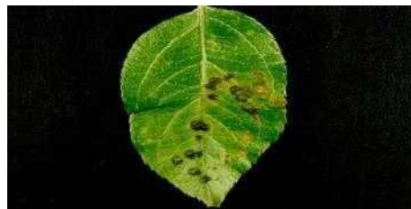
【검은별무늬병 - 사과】

➡ 약제선택은 농약정보서비스(http://pis.rda.go.kr) , 작물보호제 지침서 를 참고하시고 관할 농업기술센터 또는 농업기술원에 문의하세요.