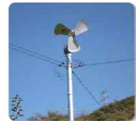
<방상팬 이용 송풍>