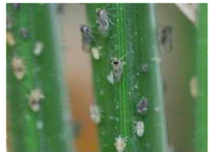
【애멸구 약충 및 성충】