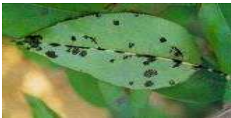
【검은별무늬병 - 배】