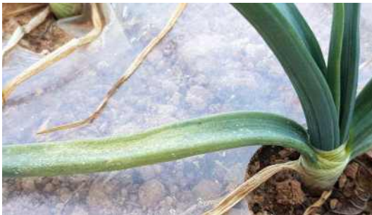
【양파 생육기 노균병】

2차 감염은 병징 부위가 장타원형의 백색 모자이크 증상 등 흰색 얼룩 반점 또는 회색 병반이 발현되다가 담황색 또는 담황 백색인 장타원형의 큰 병반을 만들고 그 위에 백색 또는 짙은 회색 곰팡이가 생겨 잎 전체로 퍼지는데 심하면 구부러지며 뒤틀림