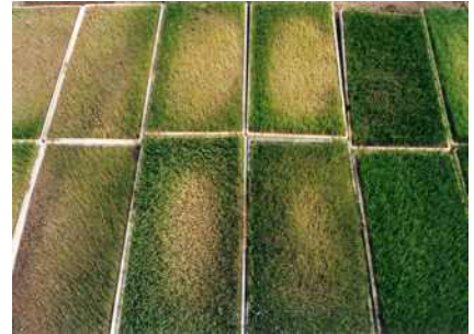
【벼 못자리 병해(모 잘록병)】