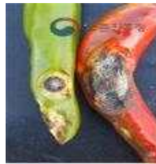
【고추 탄저병 피해】

➡ 약제선택은 농약정보서비스( http://pis.rda.go.kr ), 작물보호제 지침서를 참고하시고 관할 농업기술센터 또는 농업기술원에 문의하세요.