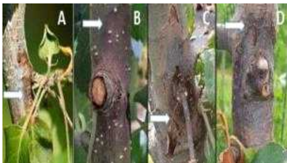
【과수화상병 병징: 수침상 시기별 변화(좌우)】