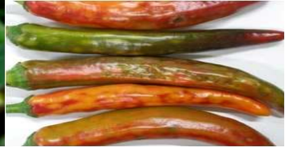
【토마토반점위조바이러스 증상: 고추】