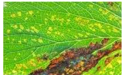
【후기 잎 증상】