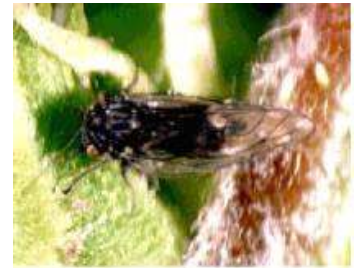
【교마배나무이 월동 성충】