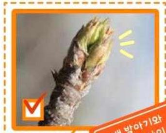
배 발아기와 전엽기 사이