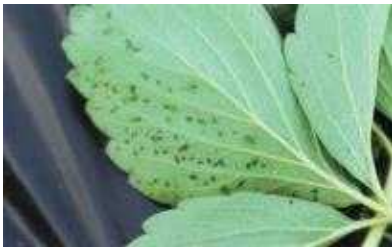
【잎 뒷면 수침상 증상】