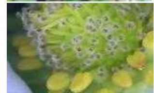
【딸기 꽃곰팡이 증상】

➡ 약제선택은 농약정보서비스( http://pis.rda.go.kr ), 작물보호제 지침서를 참고하시고 관할 농업기술센터 또는 농업기술원에 문의하세요.