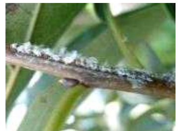
【갈색날개매미충 산란 난과】

➡ 약제선택은 농약정보서비스( http://pis.rda.go.kr ), 작물보호제 지침서를 참고하시고 관할 농업기술센터 또는 농업기술원에 문의하세요.